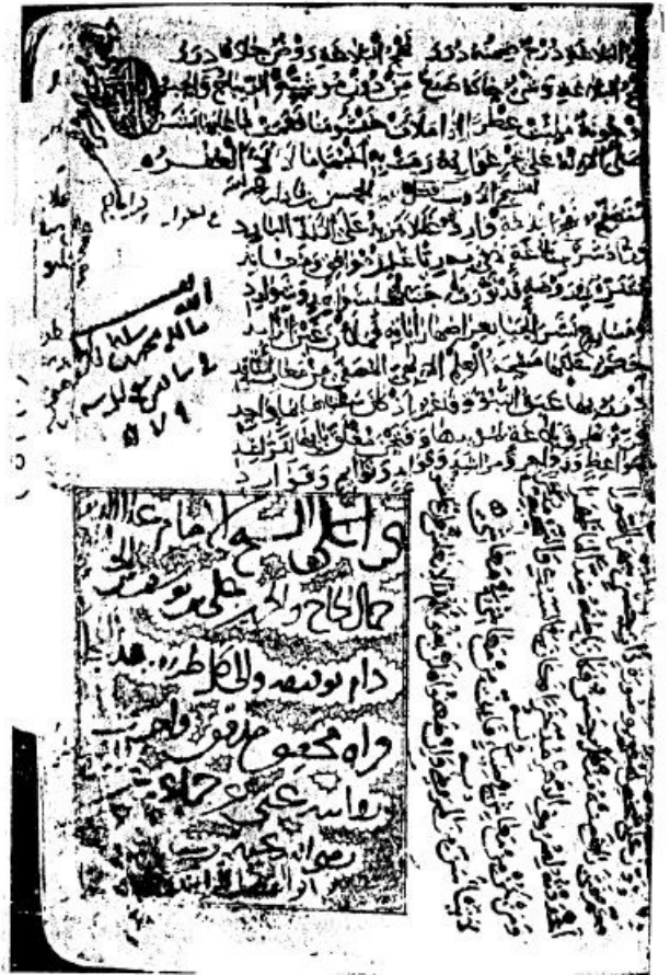
مصورة الورقة الأخيرة من نسخة «تهج البلاغة»، تظهر فيها إجازة المؤلف ظهير الدين أبي الفضل الراوندي